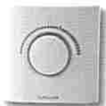
Thermostat ERT20 électronique plancher chauffant 220v