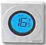
Thermostat électronique simple série S