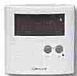
Thermostat ERT30 digital plancher chauffant 24V