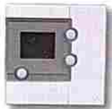
Thermostat digital simple