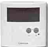
Thermostat ERT30 digital plancher chauffant RF