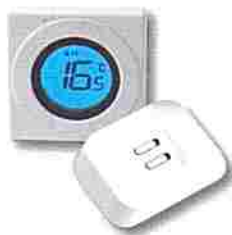
Thermostat électronique simple RF série S