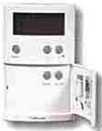
Thermostat ERT50 programmable plancher chauffant RF