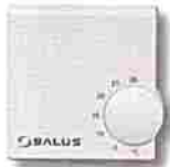
Thermostat RT électronique plancher chauffant 24v