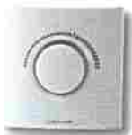
Thermostat ERT20 électronique plancher chauffant 24v