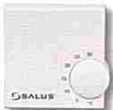
Thermostat RT électronique plancher chauffant 220v