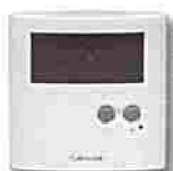
Thermostat ERT30 digital plancher chauffant 220V